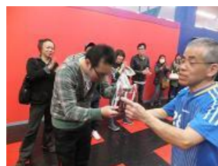
桜の木と白欖の木を頂きました